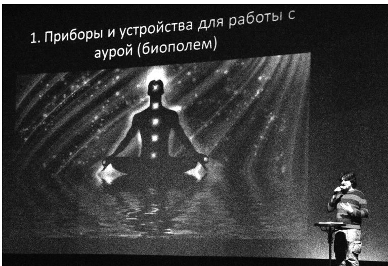
1. Приборы и устройства для работы с аурой (биополюс)

Учредитель — ТГУ Главный редактор Ирина Геннадьевна Попова Дизайн, вёрстка Елена Симанькина Корректор Лариса Николаева